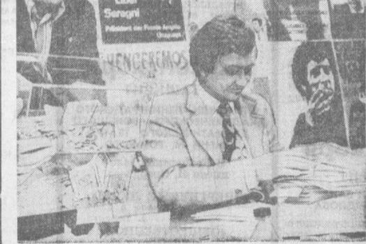
По всей нашей стране проходят массовые митинги солидарности с чилийскими патриотами. В Москве митинг и собрание проходит во всех странах мира. На снимке: Д. Флетчер в СССР. 22.09.74

— В том, что Москва — это одна из самых гостеприимных столиц мира, я убедился еще 15 лет назад, посетив ее впервые в качестве туриста. Сейчас к этому первому впечатлению добавилось другое: Москва — одна из самых трудоблагодатных столиц. Принято было видеть, как торжественно собирается в обшине москвичи радилине с деловым, конструктивным подходом к делу, обсуждающему проблемам. Что же касается посещения Звездного горки, то здесь обобщенным, так как я буквально очарован и его хозяевами и всем, что увидел в этой замечательной космической академии.