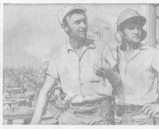
Передовые операторы установок Полторачиной опытной станции в шахте имени Фрунзе.