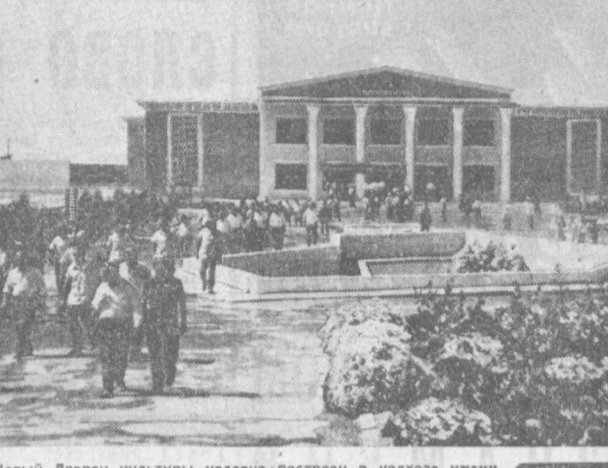
Новый дворец культуры недавно построен в колхозе имени Димитрова Джалкентского района. Зал вмещает 600 человек.