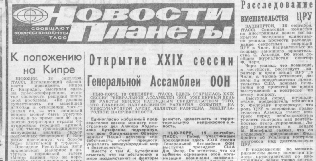
СОВРЕМЕННЫЕ ПЛАНЕТЫ. К ПОЛОЖЕНИЮ НА КИПРЕ.