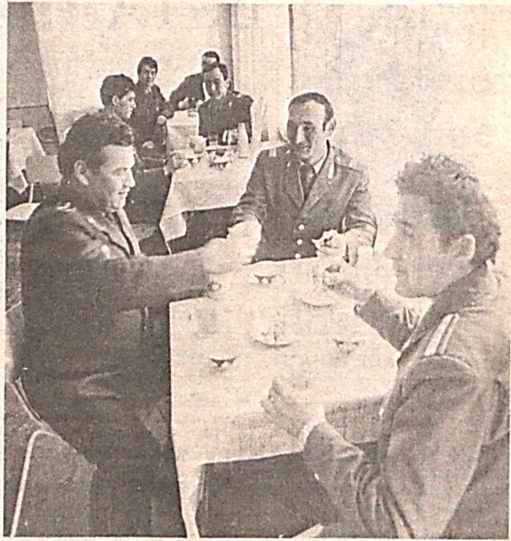
Новая столовая на 21 посадочное место открылась для сотрудников ОВД Турткульского райисполкома.