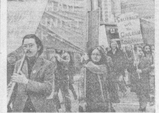
На самых разных языках, во всех уголках планеты звучит гласное требование народов предратифицировать свободу, восстановить свободу и демократию в Чили. На снимке: жители Лондона на демонстрации солидарности с чилийскими патриотами.

Демократическое сопротивление является интересом широких масс Чили, извлекает уроки из прошлого и устремляет свои взоры в будущее.