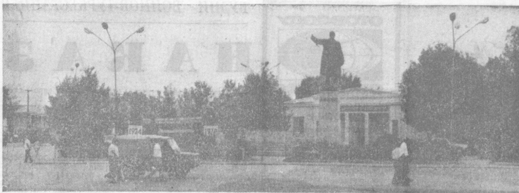
ПО ГОРОДАМ УЗБЕКИСТАНА. Площадь имени В. И. Ленина в Чирчике.

Участники совещания обменялись опытом работы, привели примеры сельского пропагандиста и агитатора, кроваго бойца идеологического фронта в дни уборочной страды личным примером, страстным партийным словом звать хлопкоуборочников на выполнение планов и обязательств.