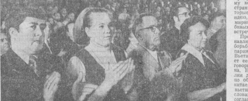
В зале заседаний проходящей в Самарканде международной встречи общественности «Борьба за мир и безопасность в Азии — насущная задача современности».

Ждала летчика-космонавта СССР, Героя Советского Союза О. Г. Макарова и прибывших вместе с ним московских ученых из Института космических исследований. Гости осмотрели памятники древнего зодчества, познакомилась с новостройками современного Самарканда. Они побывали у учащихся и преподавателей средней школы № 14, расположенной в новом микрорайоне города. Осветители космоса встретили также со студентами и преподавателями Государственного университета имени Алишера Навои. Участники встреч с большим вниманием слушали рассказ О. Г. Макарова о работе на космическом корабле, о жизни и труде славной семьи советских космонавтов. Из Самарканда гости вернулись в Ташкент. Вечером 26 сентября летчик-космонавт СССР О. Г. Макаров отбыл в Москву.