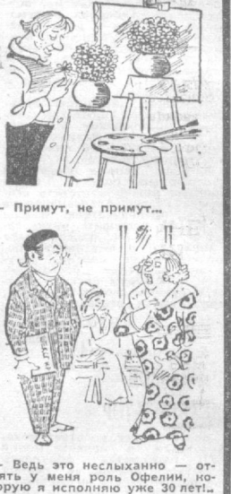
Принут, не примут...