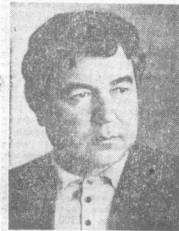
Рамз БАБАДЖАН, лауреат Государственной премии СССР

Узбекская литература уже давно вышла за границы республики и пределы страны. Перевернувшись на десятилетия языков народов СССР и мира, она рассказывает читателям об изменениях, которые за короткий исторический срок произошли на древней земле.