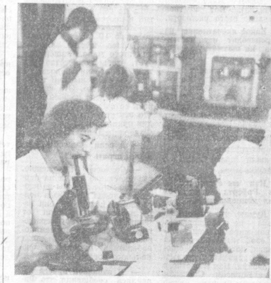
Хлопкоочистительные заводы Ферганской области в нынешнем году поставят странам социалистического сотрудничества 60 тысяч тонн первосортного хлопка-волокна. На снимке: в лаборатории Ташкинского хлопкозавода.