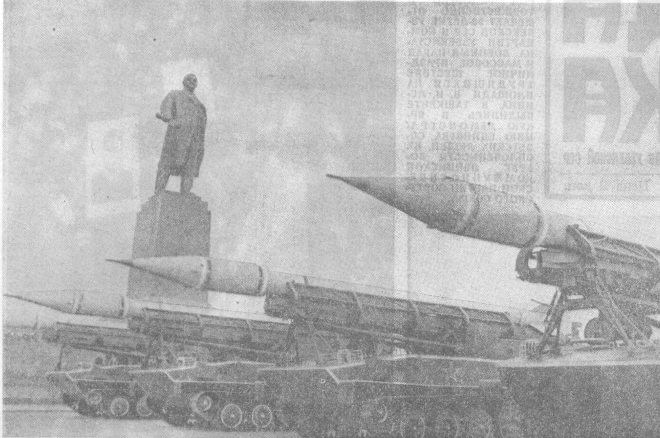
Ташкент, 23 октября. Военный парад.