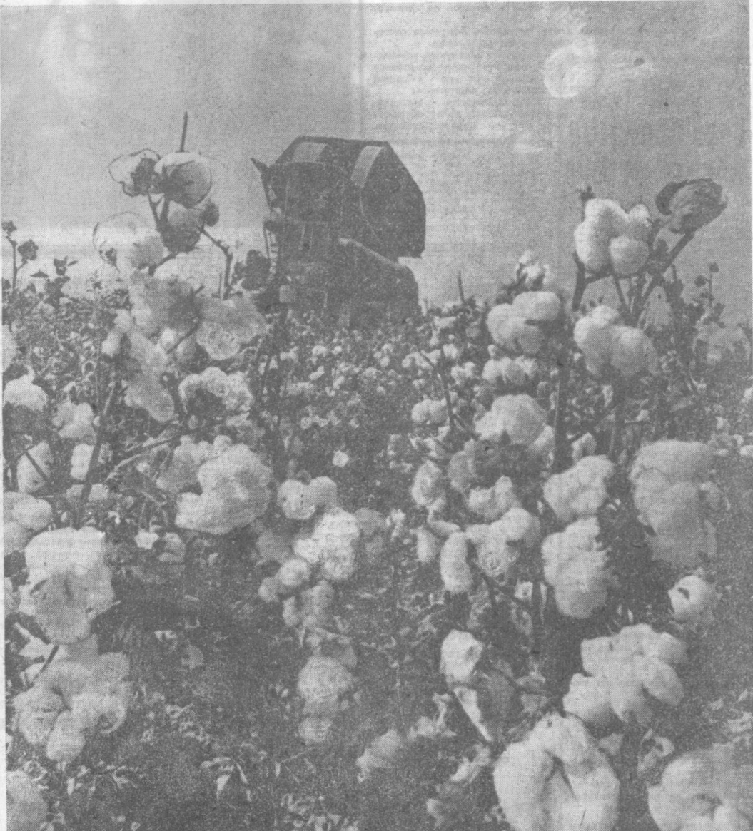
Еще не виден груза тяжелее Полей узбекских асимй небоскоп! Вот хлопок золотого юбилея — Пять миллионов полновесных тонн. Народ их убирал трудом упорным, Блистающие белоснежно горы, И помини, выходя на рубежи: Дал слово партии — сдержит! И вымпол на ветру в ладоши хлопнул — Победный караван, страна, встречай! Пусть славу людям, славысловые хлопку Торжественно тировозглавы карнай. Рауф ТАШНОВ.

Из этих тысяч тонн хлопка и сложилась белая гора в 5 миллионов. Но сбор урожая продолжится. Впереди новая высота — 5 миллионов 100 тысяч тонн. Еще одно решительное усилие, и она будет покорена!