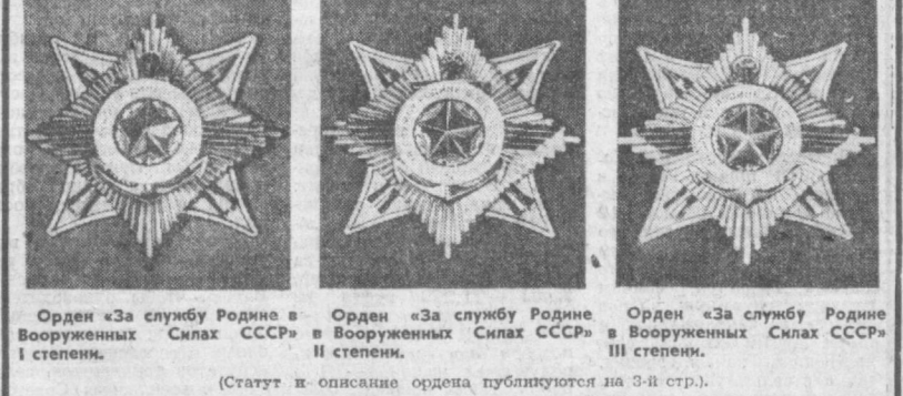
Орден «За службу Родине в Вооруженных Силах СССР» I степени. Орден «За службу Родине в Вооруженных Силах СССР» II степени. Орден «За службу Родине в Вооруженных Силах СССР» III степени. (Статут и описание ордена публикуются на 3-й стр.)

Президиум Верховного Совета СССР постановляет: 1. Учредить орден «За службу Родине в Вооруженных Силах СССР» I, II и III степени для награждения военнослужащих, Советской Армии, Военно-Морского Флота, пограничных и внутренних войск. 2. Утвердить статут ордена. Председатель Президиума Верховного Совета СССР Н. ПОДГОРНЫЙ, Секретарь Президиума Верховного Совета СССР М. ГЕОРГАДЗЕ. Москва, Кремль, 28 октября 1974 г.