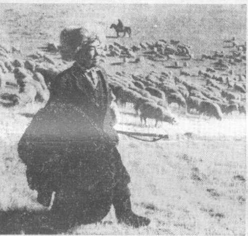
Расцветает экономика братской Киргизии. На верхнем снимке — перевал киргизского автомобилестроения Фрунзенской автосборочной завода; на нижнем снимке — отары овец колхоза имени XXII партсъезда Ат-Башинского района Нарынской области.