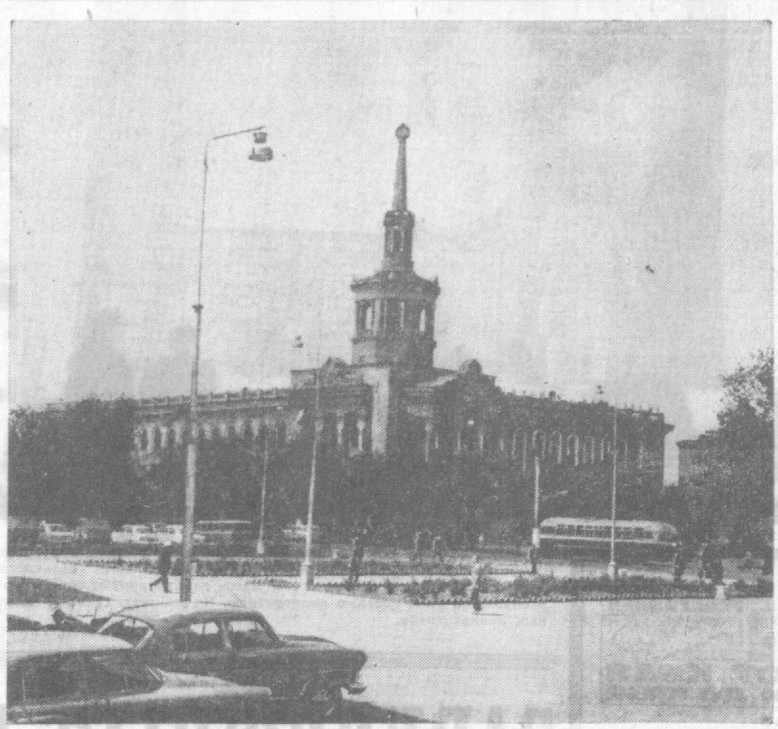
Столица Киргизской ССР — г. Фрунзе. Советская площадь.

В публикуемых материалах мы рассказываем о социалистических преобразованиях, о трудовых буднях, о людях Киргизстана.