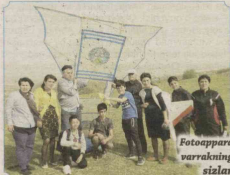
Fotoapparatga muhrlangan mega varrakning uchirish jarayonini sizlarga ham ilindik.

Gap shundaki, ijodiyot markazi to'garagi a'zolarining bir guruhi 31-mart kuni Toshkent viloyati, Parkent tumanidagi so'lim So'qoq qishlog'ida mega varrakni osmon-u falakka uchirdi. Bo'yi 3 metr-u 10 santimetr, eni 2 metr-u 75 santimetrga teng bo'lgan, Respublika BABMning logotipi tushirilgan varrak oz emas, ko'p emas, 200 metr balandlikka ko'tarildi.