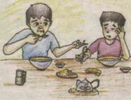
Painter: Yoqubbek HALIMBEKOV