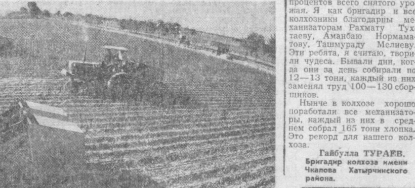
Колхоз «Иттифак» Нарвайского района продал государству около 11 тысяч тонн хлопка при плане 8,5 тысячи тонн. Но шум моторов на полях не стихает. На завершающем этапе страды на смену уранкоуборочным машинам вышли борщины хлопка. Сбор урожая продолжается.