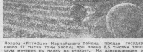
Колхоз «Иттифак» Нарвайского района продал государству около 11 тысяч тонн хлопка при плане 8,5 тысячи тонн. Но шум моторов на полях не стихает. На завершающем этапе страды на смену уранкоуборочным машинам вышли борщины хлопка. Сбор урожая продолжается.

Базар ДЖУРАЕВ. Бригадир-механик за от совхоза «Самарканд» Пастдаргомского района.