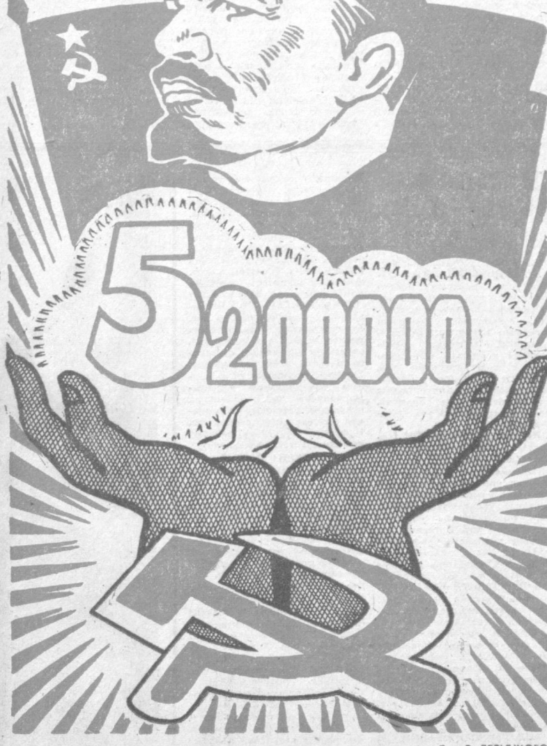
Рис. Р. ЛЕВИЦКОГО.