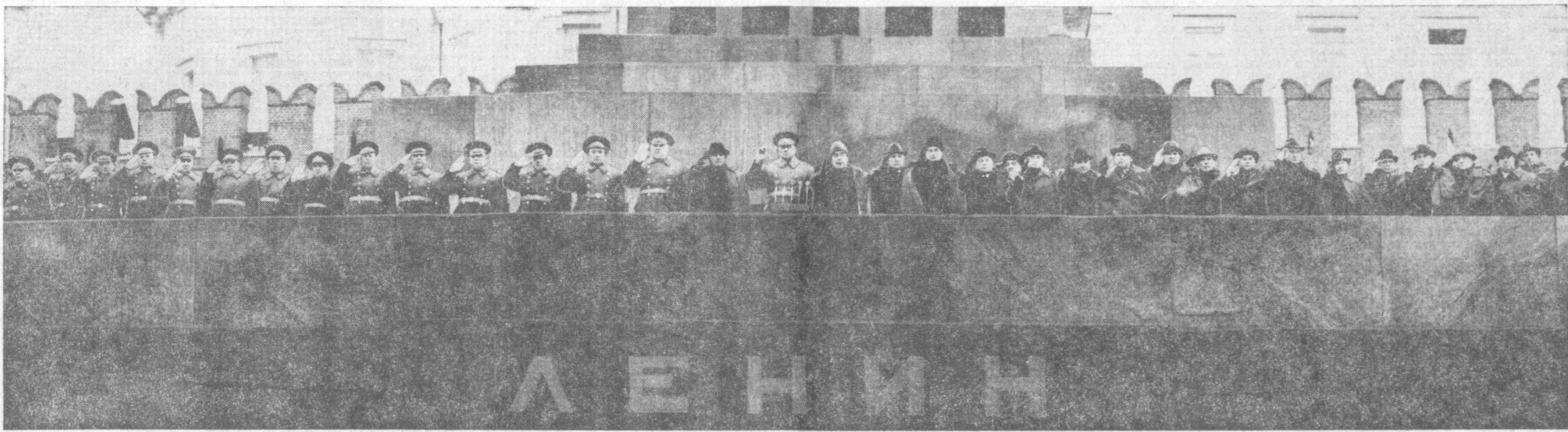
Москва. Красная площадь. Празднование 57-й годовщины Великого Октября. На снимке: на трибуне Мавзолея В. И. Ленина.

Советская страна торжественно и радостно отметила 57-ю годовщину Великой Октябрьской социалистической революции. На праздничных демонстрациях в городах и селах трудящиеся вновь продемонстрировали великое и нерушимое единство партии и народа, твердую волю советских людей с честью выполнить исторические решения XXIV съезда КПСС, задания пятилетки. Празднование годовщины Великого Октября с новой силой показало монолитную сплоченность, нерушимую дружбу и братское сотрудничество всех народов нашей Родины.