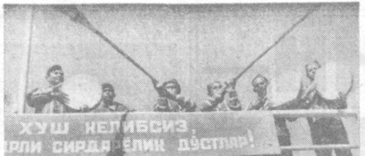
НА ФОТОКОНКУРС «ПРАВДЫ ВОСТОКА». Мы с ЦЕЛИНЫ. (На ВДНХ Узбекской ССР выступают самодельные артисты Ангалтского района). Фото А. НУРБЕКОВА. (Гулстан).