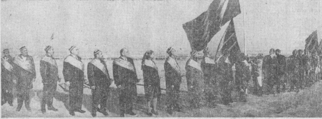
Знатные люди узбекского села поднимают флаг Праздника урожая.

Участники митинга единодушно приняли приветственное письмо в адрес ЦК КПСС, Президиума Верховного Совета СССР и Совета Министров СССР. В праздничном шествии перед трибунами ЦК КПСС, Президиума Верховного Совета СССР и Совета Министров СССР. В праздничном шествии перед трибунами ЦК КПСС, Президиума Верховного Совета СССР и Совета Министров СССР. В праздничном шествии перед трибунами ЦК КПСС, Президиума Верховного Совета СССР и Совета Министров СССР.