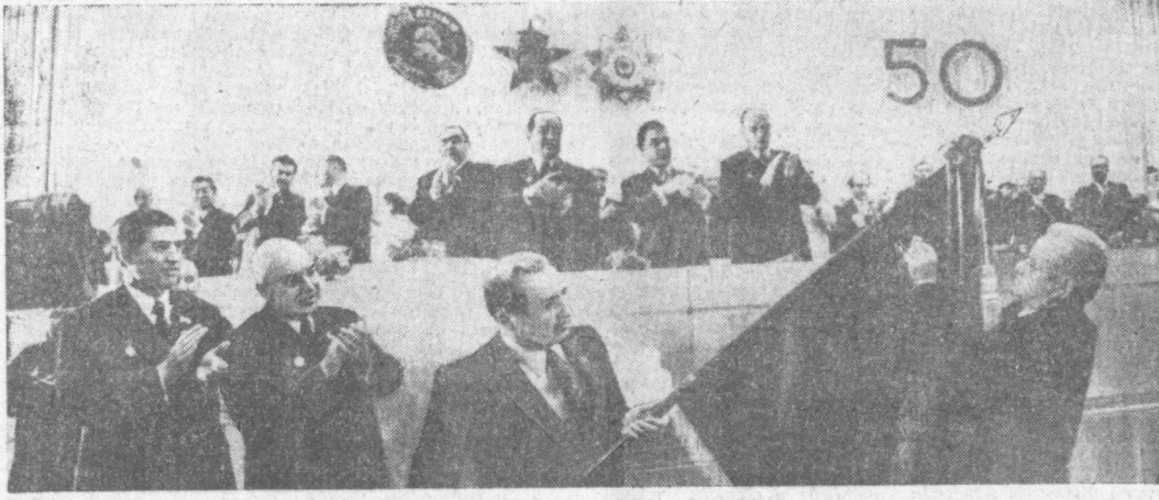
Во время вручения награды.

Да здравствует Коммунистическая партия Советского Союза — вдохновитель и организатор строительства коммунизма!