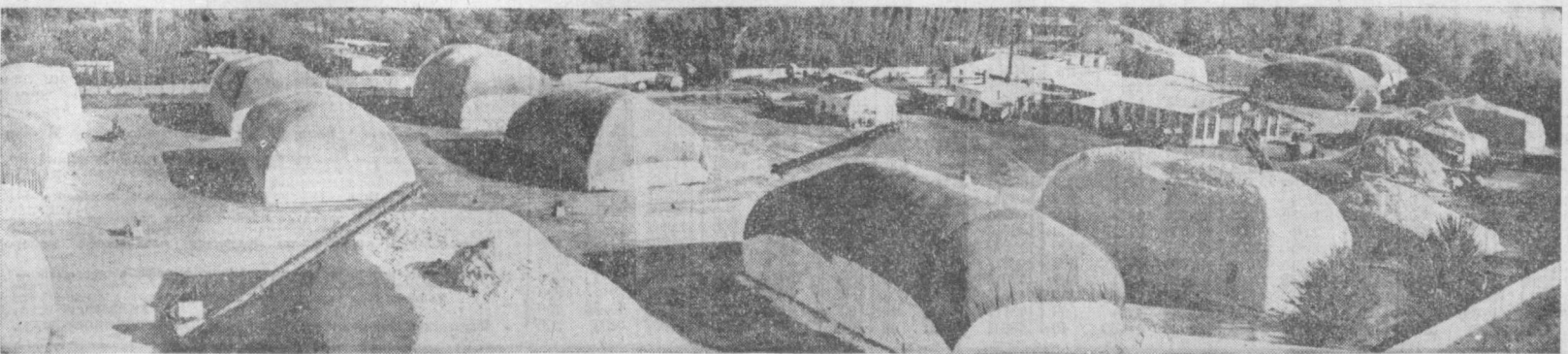
Вот оно, «белое золото» Задарьинского района! Хлопок, собранный с целинных земель, доставлен на Джумаушуский заготовительный пункт.

Д. ТАШМАНОВ. Председатель колхоза «Андаман» Учкурганского района.