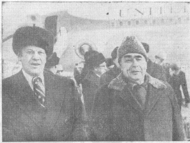
23 ноября во Владивосток для встречи с Генеральным секретарем ЦК КПСС Л. И. Брежневым прибыл Президент США Джеральд Форд. На снимке: Л. И. Брежнев и Дж. Форд на аэродроме.