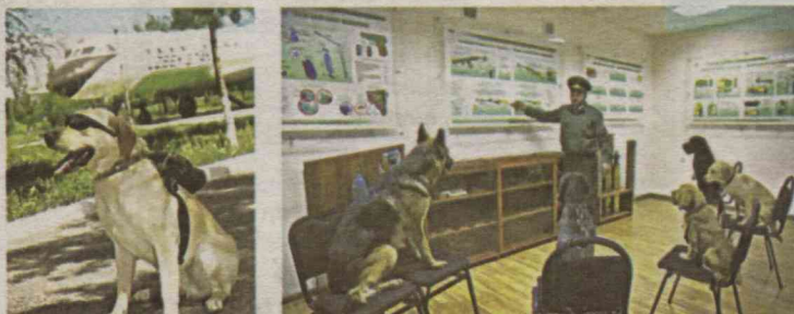
Xizmat itlari mashg'ulotlaridan qiziqarli fotolavhalar.

yo'lga o'rgatish, ularda buyruqlarni so'zsiz bajarish ko'nikmasini shakllantirish katta mehnatni talab etadi. Kinologlar esa barcha qiyinchiliklarni yengib o'tib, tilsiz jonivorni tovush yoki ishora orqali istalgan holatga tez va aniq bo'ysunishga, boshqarishga o'rgatadi. Bu esa juda katta mahorat va tajriba natijasidir. Shu bois, soha xodimlarining mehnati tahsinga loyiq. Ular xizmat itlari bilan birgalikda yurtimizga noqonuniy kirib kelayotgan tovarlar, giyohvand moddalar, qurol-aslahalar va portlovchi moddalarni oldini olishda, jinoyatchi-