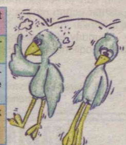
Painter: Sumbula MELIMURODOVA