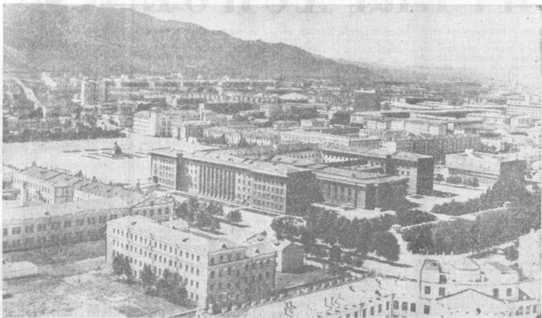
Улан-Батор — красный богатырь — так назвали монголы свою столицу после провозглашения Народной Республики в 1924 году. За последние 20 лет здесь стало в 5 раз больше жителей. Только в нынешнем году еще полторы тысячи семей уланбаторцев устроились в квартирах — таков сегодняшний Улан-Батор.