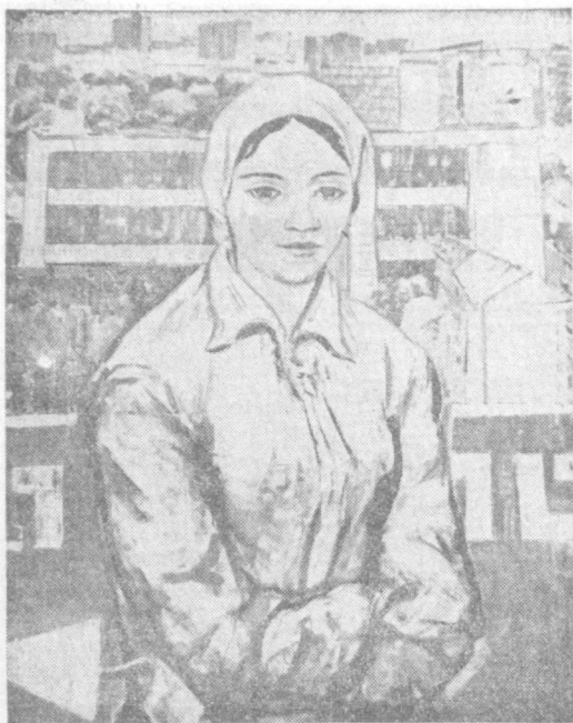
В мастерской художника