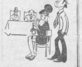
— Вы же недавно познакомились, а уже разводитесь? — Приходите, отец больше не хочет содержать нас.