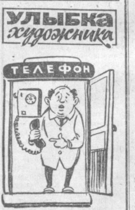
— Ну и автомат! Точь в точь как сын мой: деньги берет, а работать не хочет...