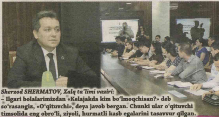
Sherzod SHERMATOV, Xalq ta'limi vaziri: – Ilgari bolalarimizdan «Kelajakda kim bo'lmoqchisan?» deb so'rasangiz, «O'qituvchi», deya javob bergan. Chunki ular o'qituvchi timsolida eng obro'li, ziyoli, hurmatli kasb egalari tasavvur qilgan.

Shu bois, yana shu qadriyat va sharafni tiklash, pedagog xodimlarning sifatli ishlashi uchun sharoit yaratish, ularni faqat va faqat barkamol avlodni voyaga yetkazishga qaratilgan yumush-