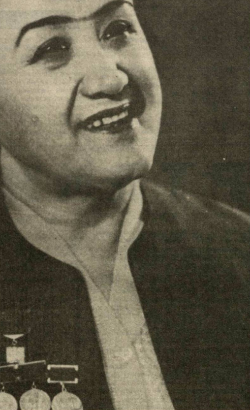
СУРАТДА: СССР халқ артисти Мукаррам Турғунбоева

тарди. Шу пайт елкамга бирор аста қўлини қўйди. Илт этиб ўтирилдим. Яқинда танишган ҳиндистонлик оғайним — доктор Чапа экан. «Қасал тугалиниси келса, табиб ўзи ёзи билан келди», деганларидай болани топсаю ота-онаси кўрсатсам, деган хайлдан сениб кетдим. Воқеани тушунтириб, болани қидиришга йўл олдим. Чапа бу ишларга қўниқиб кетгани учун менинг хатти-ҳаракатимдан таажублаланди. Ниҳоят, болани кўриб қолдим. Чапанинг юзидан кўзга кўриб қолган сурдари, Рафиқ Мухаммад экан. Боладан унинг қарда, деб сўрадик. Бола қўли билан яқинда, деб ишора қилди. Мен Чападан унинг онасини кўриб қўйишни илтимос қилдим. У доктор бўлганлиги учун сўзимни қайтарган олмади. Боланинг уйи аллақандай чуқурлик ёнидаги чайла экан. Чуқурликдаги қачонларидир тўпнаниб қолган ёмғир сувини, ё ер остидан сиқиб чиққан бўлоқ сувини, ҳар қалай, ҳовуз сингари тўпнаниб сувда қимдир кир ювар, қимдир боласини чуқурликнинг ниҳоятда ифлосланган сувнинг ранги ўзгартиб кетган эди. Атрофда чайлалар, лойдан номига