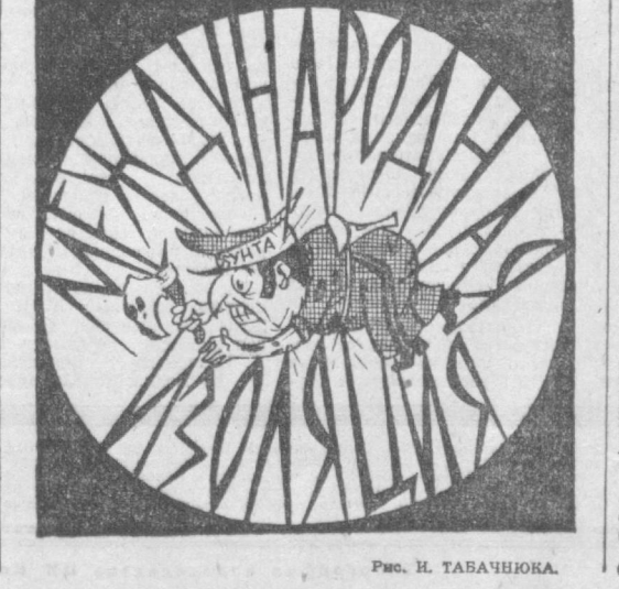
Рис. И. ТАБАЧУКА.