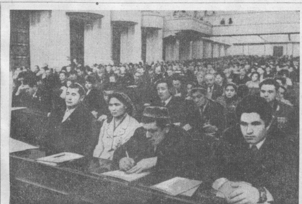
Сессия Верховного Совета СССР. На снимке: депутаты из Узбекской ССР в зале заседаний.

Коллективы предприятий Министерства местной промышленности Узбекской ССР выполнили годовую план по объему реализуемой продукции. Сверх плана будет реализовано продукции на 7 миллионов рублей. (УзТАГ).