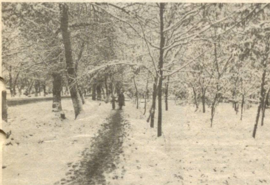
Қор ортида баҳор нафаси...

Ўз уйингга киришда ҳам салом билан киргин, шун- да узингга ҳам, оилангга ҳам барака ҳосил булур.