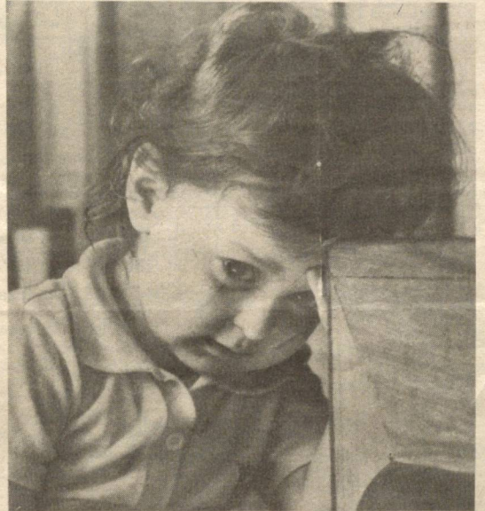
— Уфф... Чарчаб кетдим...