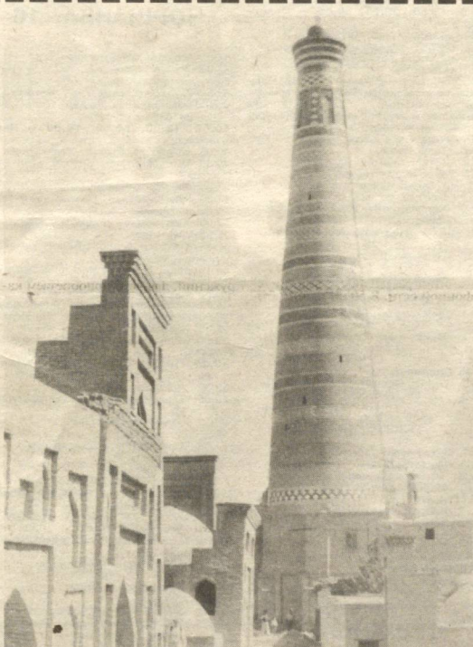
Хива. Исмолхўжа минораси

Ёшлиқда олинган билим тошга ўйилган нақш каби-дир. ***