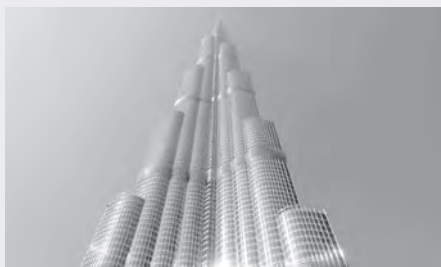
Бурж Халифа биноси. Баландлиги – 828 метр. Қурилиш харажати – тахминан 1,5 миллиард АҚШ доллари.

Сиз мана бу икки суратга қараб, бир уринишда жавоб беринг. Жойини айтишга зарурат йўқ. Қайси бир ҳолатдан «коррупция ҳиди» келяпти?