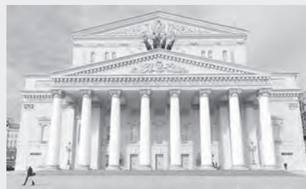
Катта театр биноси. Баландлиги – 43,5 метр. Таъмир харажати – тахминан 1,5 миллиард АҚШ доллари.