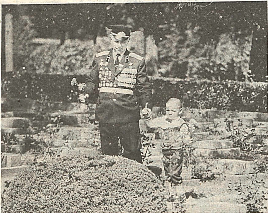
Никто не забыт, ничто не забыто.