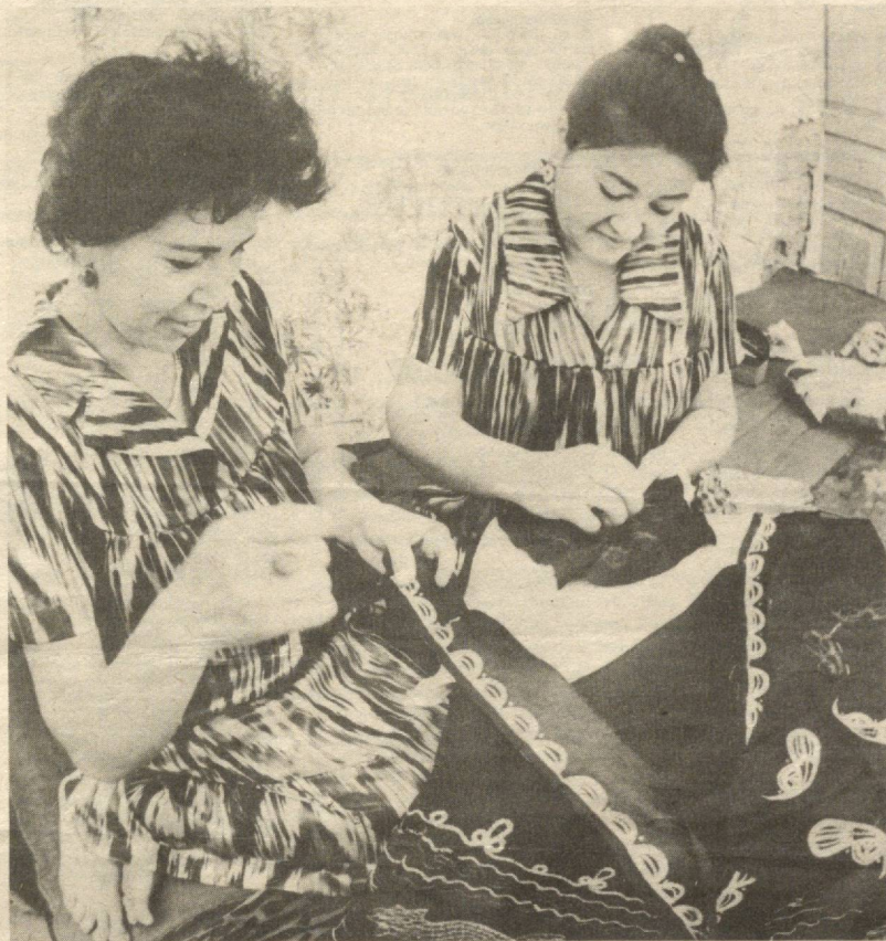
Дўппи тикдим ипаклари тиллодан.

Мўмин кишига берилган нарсаларнинг яхшиси чиройли хулқдир. Унга берилган нарсаларнинг ёмони эса, кўриниши чиройли бўлса-да, қалбида ёмонлиги бориридир.