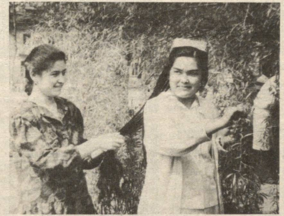
Сочилган сочингдек сочилса сиринг...