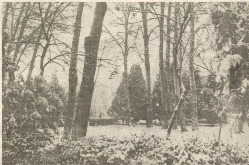
Бул ажойиб кун эрурким, Ялтирар ҳар ёнда қор.

Яхшиликка буюринглар, агар ўзларинг қила олмасаларинг ҳам. Ёмонликдан қайтаринглар, агар унинг ҳам-масидан ўзларинг четлана олмасаларинг ҳам.