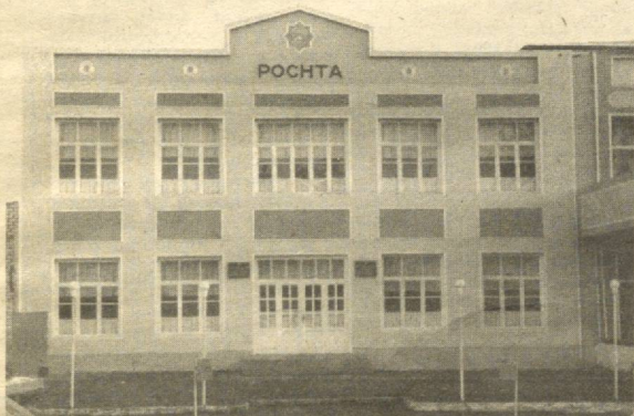
Мустақиллик йилларида бунёд этилган «Андижон почтаси» Шахрихон филиали биноси.