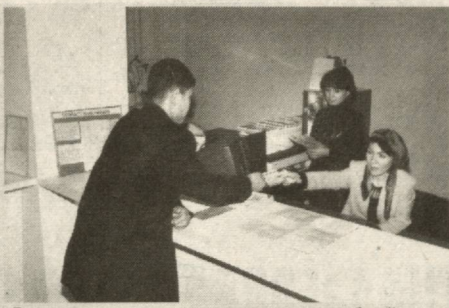
Гулистон туманидаги "Фаррух" фермер хўжалиги раҳбари...

"Алоқа-савдо", "Файз-савдо" ва бошқа хизмат кўрсатиш шохобчалари пластик карточкалар орқали тўловларни қабул қилмоқда.