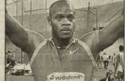
Гран-при туркумига кирувчи мусобақаларида Асафа Пауэлл 100 метрлик масофани югуриб ўтиши учун 9,77 сония вақт сарфлади. Олинги рекорд соҳиби эса америкалик Тим Монтомери эди. Унинг кўрсаткичи 9,78 сония. Қизиқарлиси, мусобақадан олдин Пауэлл албатта 2002 йил Монтомери томонидан ўрнатилган рекордни "чилларчин" қилишини айтиб ўтган.

Афинадаги Олимпиада стадионида ўтказилган Халқаро энгил атлетика федерациясининг