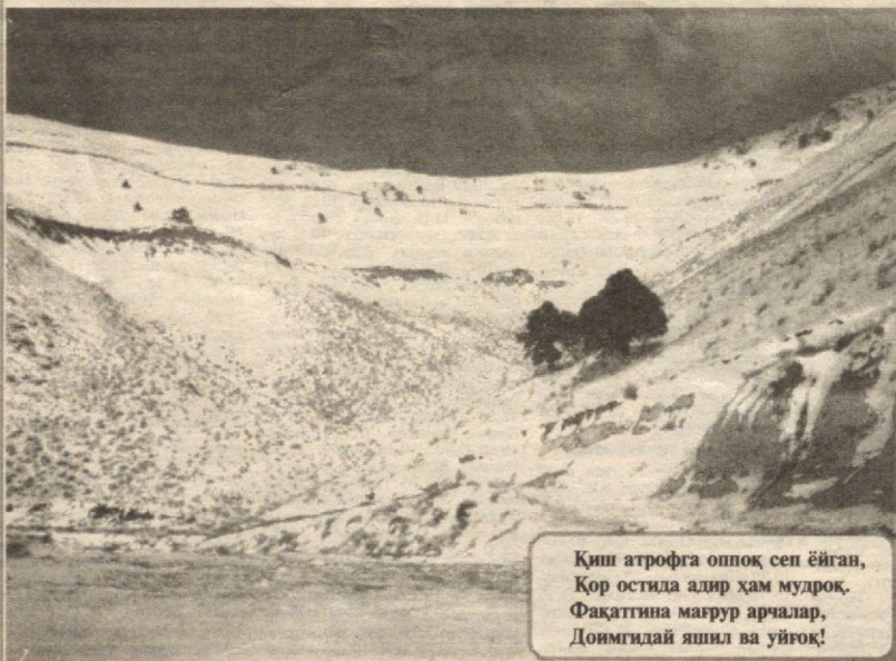
Қиш атрофга оппоқ сеп ёйган, Қор остида адир ҳам мудроқ. Фақатгина мағрур арчалар, Довмигдай яшил ва уйғоқ!