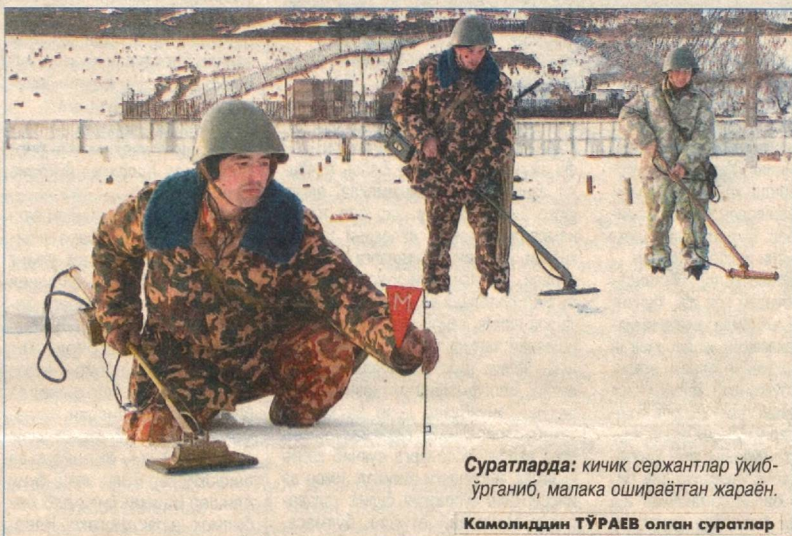
Суратларда: кичик сержантлар ўқиб-ўрганиб, малака ошираётган жараён.

Равшан ШОДИЕВ, «Ўзбекистон овози» мухбири