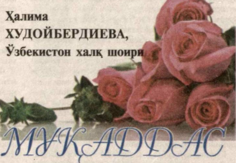
Халима ХУДОЙБЕРДИЕВА, Ўзбекистон халқ шоири