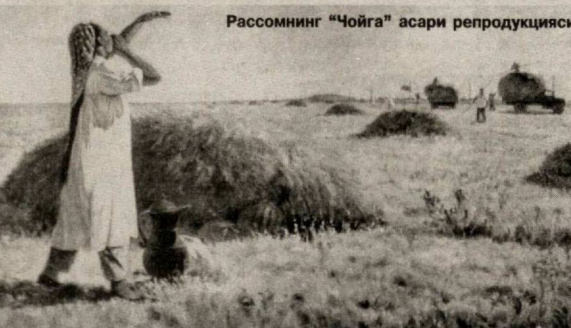
Рассомнинг "Чойга" асари репродукцияси