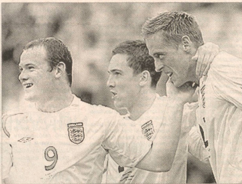
дай қилиб, Эквадор жамоаси ним чорак финалга чиқишни нақд қилиб қўйди.

«А» гуруҳида яна иккита учрашув бўлиб ўтди. Германия — Польша ўйинида дарвозага битта тўп киритилиб, майдон эгалари муваффақият қозонган бўлса, Эквадор — Коста-Рика футболчилари учрашувда дарвозага учта жавобсиз тўп йўллади. Умуман, Эквадор футболчиларининг ўйинлари мухлисларга маълум тушди. Учрашувнинг 8-дақиқасида Карлос Тенорио ҳисобни очган бўлса, 56-дақиқага борганда эквадорлик ҳужумчи Агустин Дельгадо ўзини кўрсатди. Учрашувнинг қўшимча вақтида Иван Кавьедес дарвозани аниқ нишонга олиб галабани мустаҳкамлади. Шун-