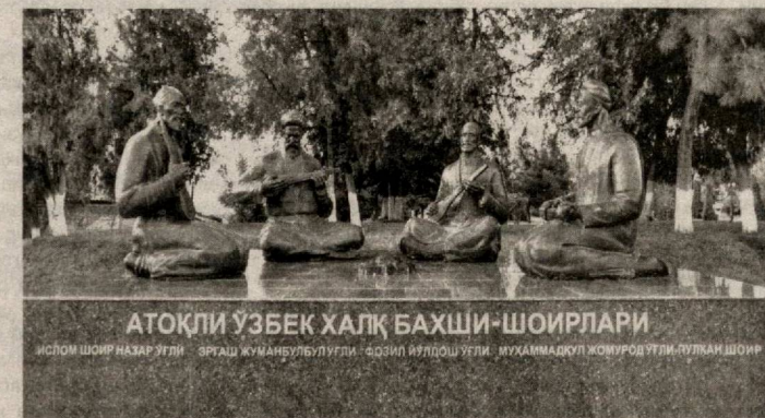
АТОҚЛИ ЎЗБЕК ХАЛҚ БАХШИ-ШОИРЛАРИ

сўзлар билдирилса-да, уларнинг истеъдодларини баҳоловчи сўз тополмаган бўламай. Уларнинг ҳар бири сўз дарёси ва илоҳий қувватга эга бўлган шахслардир.