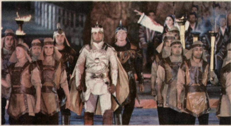
Бошланиши биринчи саҳифада.