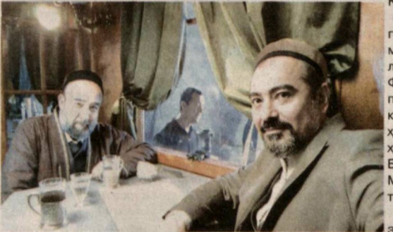
аср охири — XIX аср бошларидаги ижтимоий-сиёсий ҳамада адабий муҳити, ўша давр чигалликлари, Алишер Навоий яратган Хирот адабий муҳитидан кейинги ҳодиса сифатида эътироф топган Қўқон адабий муҳити ва унинг асосчиси — Амирий талхаллуси билан ижод қилган Амир Умархон (1787-

1822) ҳамда унинг шоира аёли — Нодира тахаллуси билан ижод қилган Моҳларойим (1792-1842)нинг ҳаёти ва фаолияти ёритилади.