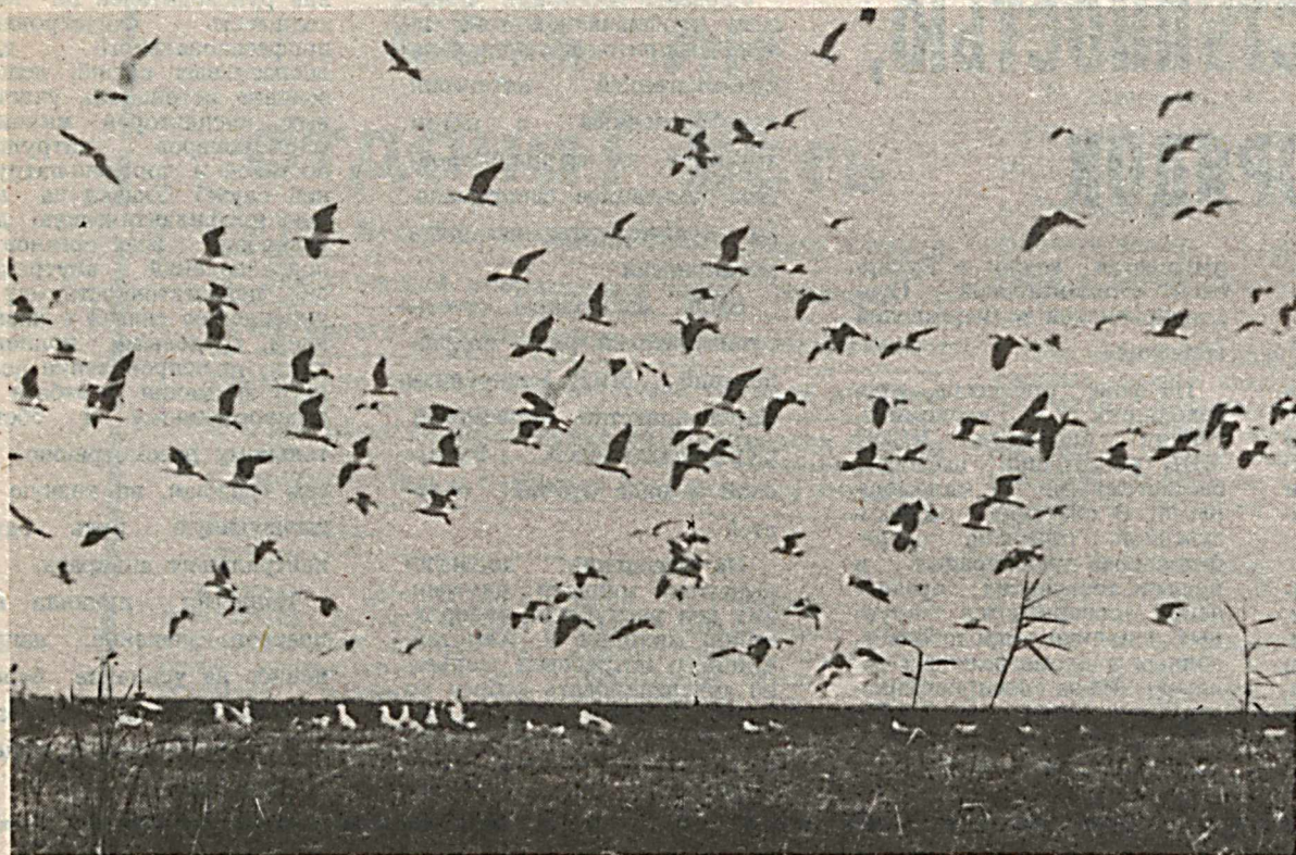
Наступила весна. Птицы возвратились из теплых краев домой. Вот и в пойме Амударьи оживление.