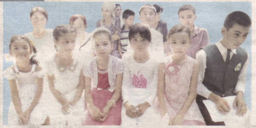
G'alaba quvonchi yangi marralar sari chorlaydi.

O'zbekiston ekologik harakati tomonidan o'tkazilgan tadbirlar atrof-muhit sofligi aholi salomatligini mustahkamlashdagi o'rni, ekologik xavfsizlikni ta'minlash borasidagi xizmatlari bilan ahamiyatlidir. Ekoharakatning navbatdagi tadbiri poytaxtimizning G'afur G'ulom nomidagi madaniyat va istirohat bog'idagi bo'lib o'tdi. Anjuman ishtirokchilari jannatmakon o'lkamiz tabiatini muhofaza qilish, mazkur tashkilot deputatlari guruhi ushbu yo'nalishdagi qonunchilikni takomillashtirish va yangilarini tayyorlash