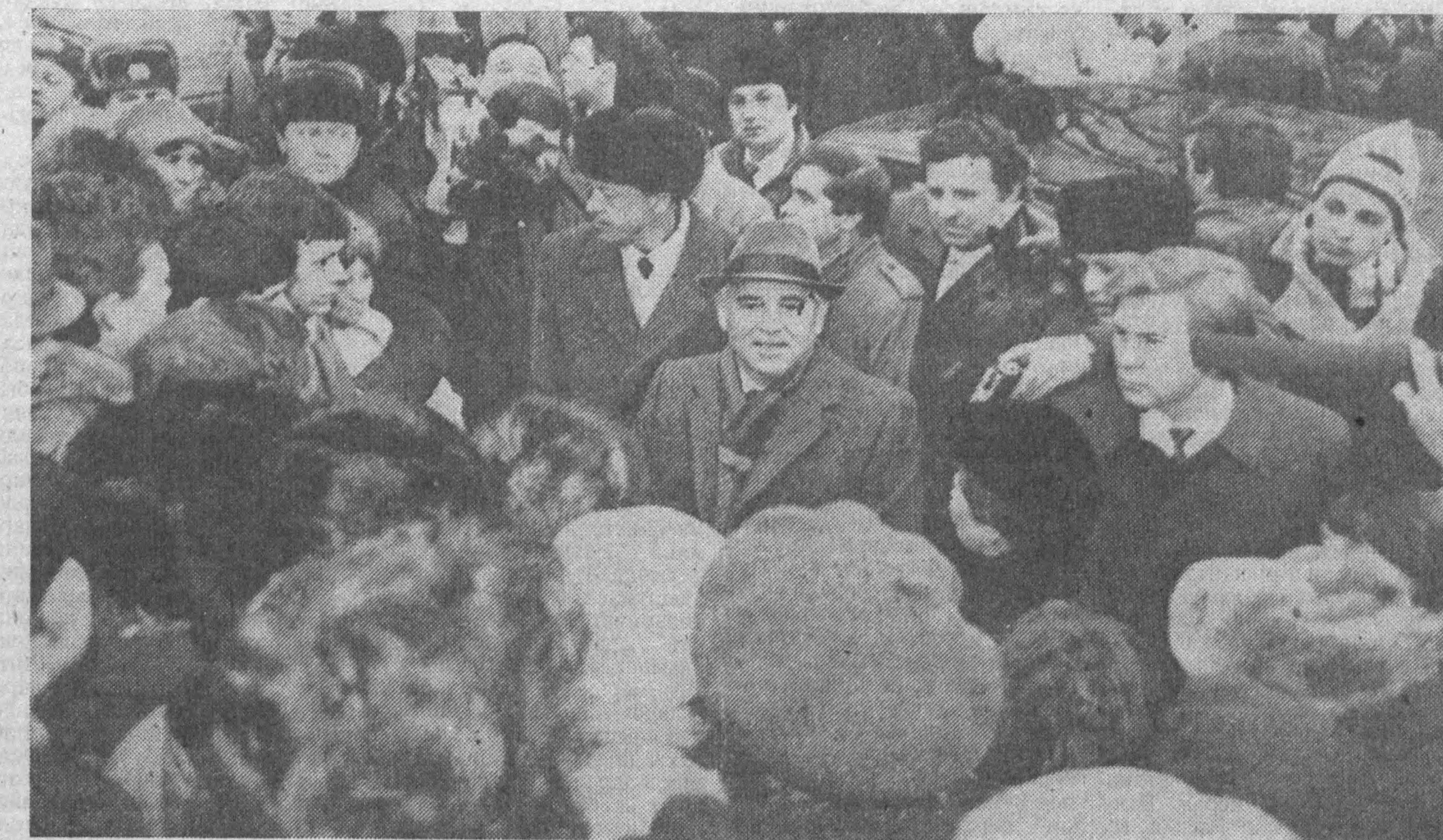
Шяуляй, 12 январь. М. С. Горбачевнинг кўчалардан бирида шаҳар аҳолиси билан учрашуви.

Овоз: Михаил Сергеевич, биз ҳаммиса иноқ бўлиб ашадик. Бир тасавур қилинг-на, неча йиллар биргаликда ашадик ва ҳеч ким ҳеч қачон ким қайси тилда гапиршишга эътибор бермади. Хар бир киши ўз имкониятига қараб меҳнат қилиши мумкин эди. Ҳозир эса бу қадрланмапти. Литвада демократия наҳот шундай йўлдан ривожланиши керак бўлса! Наҳотки, биз қайта қуришни бошлаб, шундай демократияга, ҳеч нарсада чегараси бўлмаган демократияга интилган бўлсак? Биз гачи аждодларимиз қадрларини бу