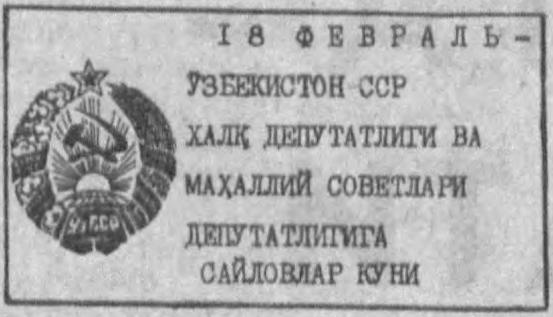
16 ФЕВРАЛЬ — ЎЗБЕКИСТОН ССР ХАЛҚ ДЕПУТАТЛИГИ ВА МАХАЛЛИЙ СОВЕТЛАРИ ДЕПУТАТЛИГИДА ОЙЛОВМАР КҮНИ

Соғидан коммунистлар ўз сафарига қабул қилинди. Энг қийин пайларда Холбуви ола завод коммунистларига етакчилик қилган, шаҳар Совети депутатлигига сайланган эди. «Энди парток секретариатини қизларга топшираман», — деди жамоа бир овоздан. Ушунда 1981 йил эди. Соғидан ҳамон партком секретари, ҳамон ишда илгор, энг юқори разрядли бичиқчи, ихтирочи. Унинг тақлифи бўйича иқтисод қилинган маҳсулотдан ҳар йили қанча-қанча бош қийимлар ишлаб чиқарилади. Яна у ишларнинг мурабийси. Утти нафар шоғирди бор. У ишларга нанин касб-ҳунар, одамийлик сабоғини ҳам ўргата олди. Қулида дипломи билан жонажон заводини тарқ этолди.