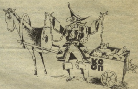
Рис. В. МУРОМЦЕВА.