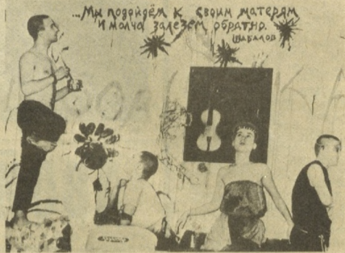
Производство киностудии «Мосфильм».