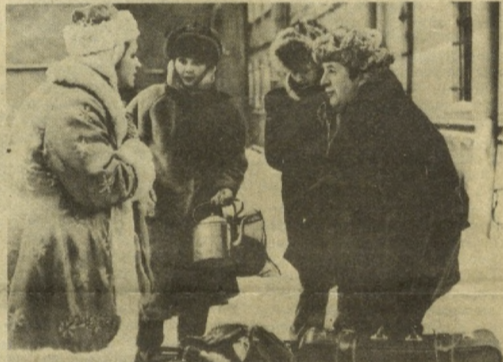
Производство киностудии «Ленфильм».