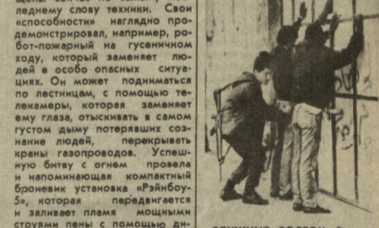
На снимке: израильские оккупанты обыскивают арестованных палестинцев.